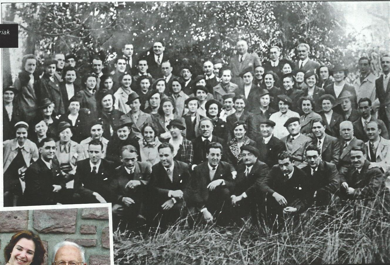
La Chorale Kantariak en 1937